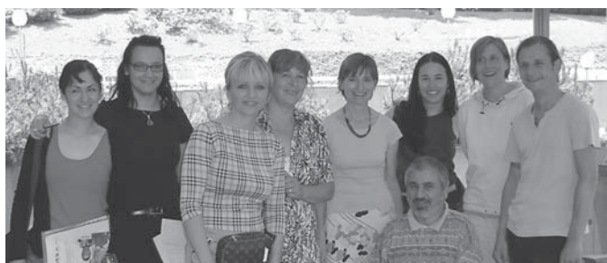
Alpe Adria Treffen - Jugendzentrum in Maribor, Juni 2005