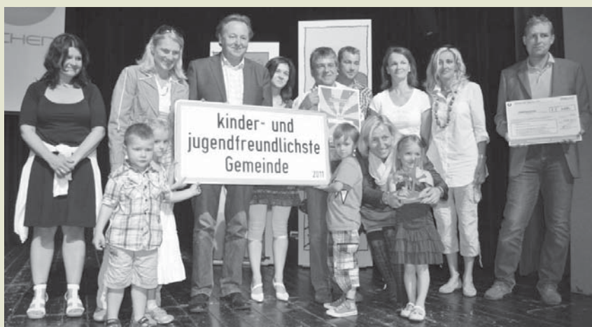
Bairisch Kölldorf - Gewinner der Kategorie „Newcomer“