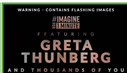
STELL DIR EINE MINU...