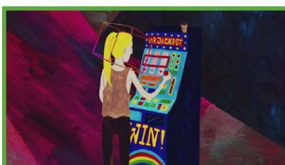
SOZIALER KÄFIG (Tsc...