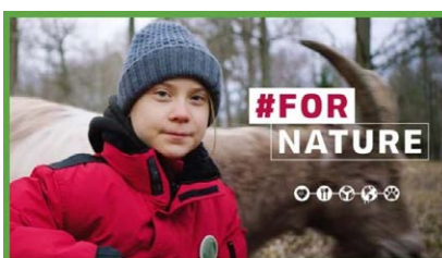
FÜR DIE NATUR (UK 2...